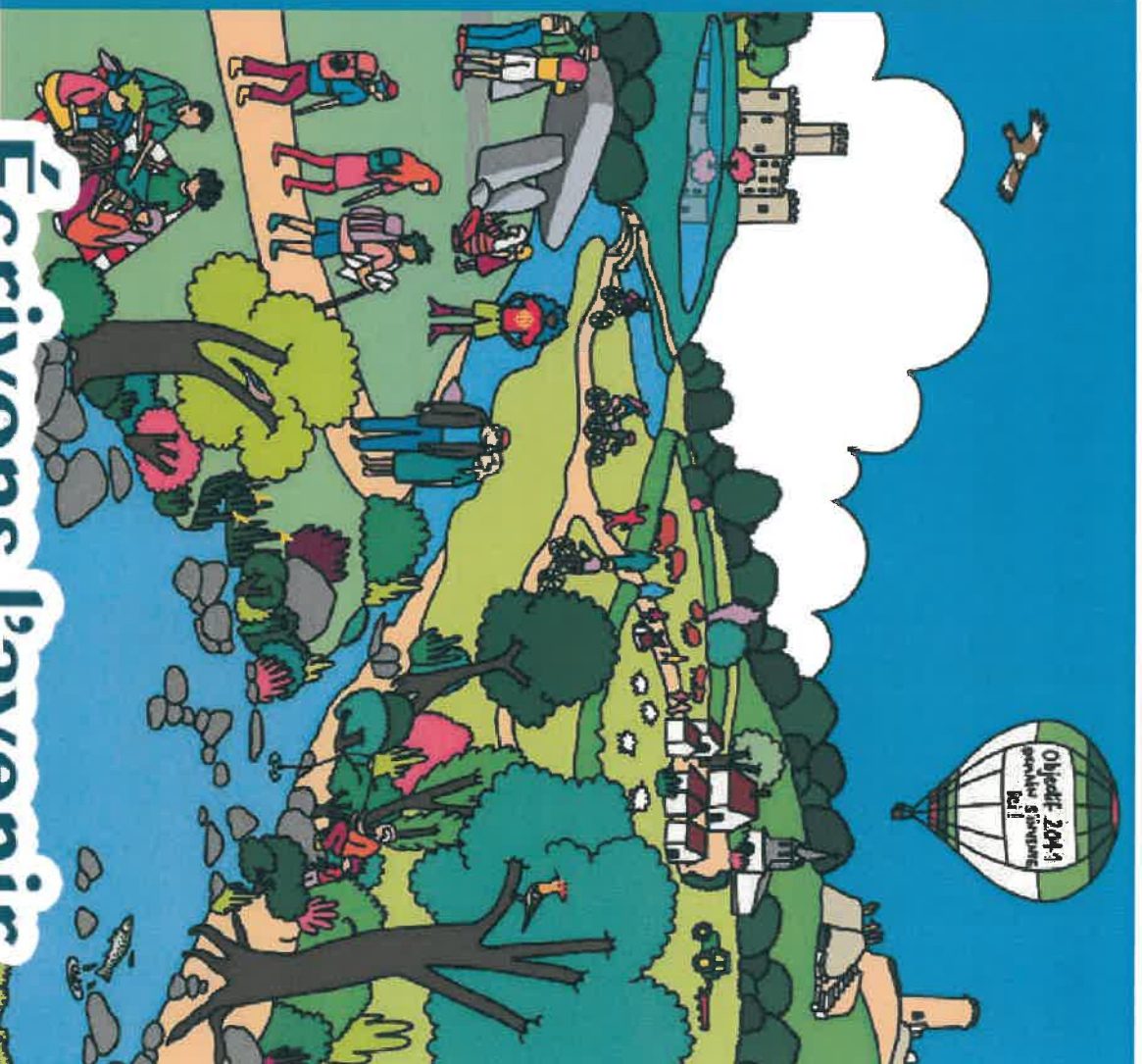
ILLUSTRATION ET MISE EN PAGE NISSA ABAËUI

Écrivons l'avenir du Périgord-Limousin !